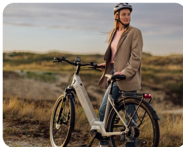
Mit dem Dienstrad in der Freizeit und im Urlaub