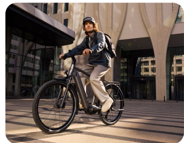
Das Dienstrad in urbaner Umgebung