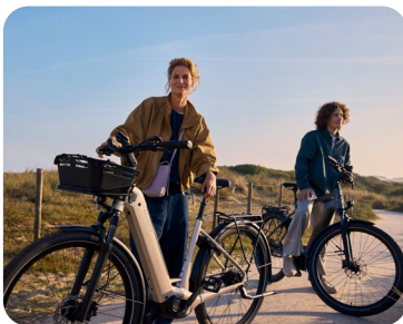
Mit dem Dienstrad unterwegs

Hinweis! Die Nutzungsrechte der Bilder gelten bis 12_2026.